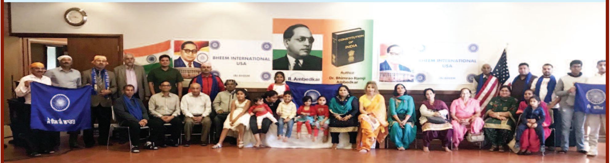
Members of BHEEM INTERNATIONAL USA

"Equality may be a fiction but nonetheless one must accept it as a governing principle."