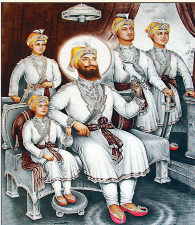
ਅਦਾਰਾ ਦੇਸ਼ ਦੁਆਬਾ ਮਹਾਨ ਸ਼ਹੀਦਾਂ ਦੀ ਸ਼ਹਾਦਤ ਨੂੰ ਕੋਟਿ-ਕੋਟ ਨਮਨ ਕਰਦਾ ਹੈ।